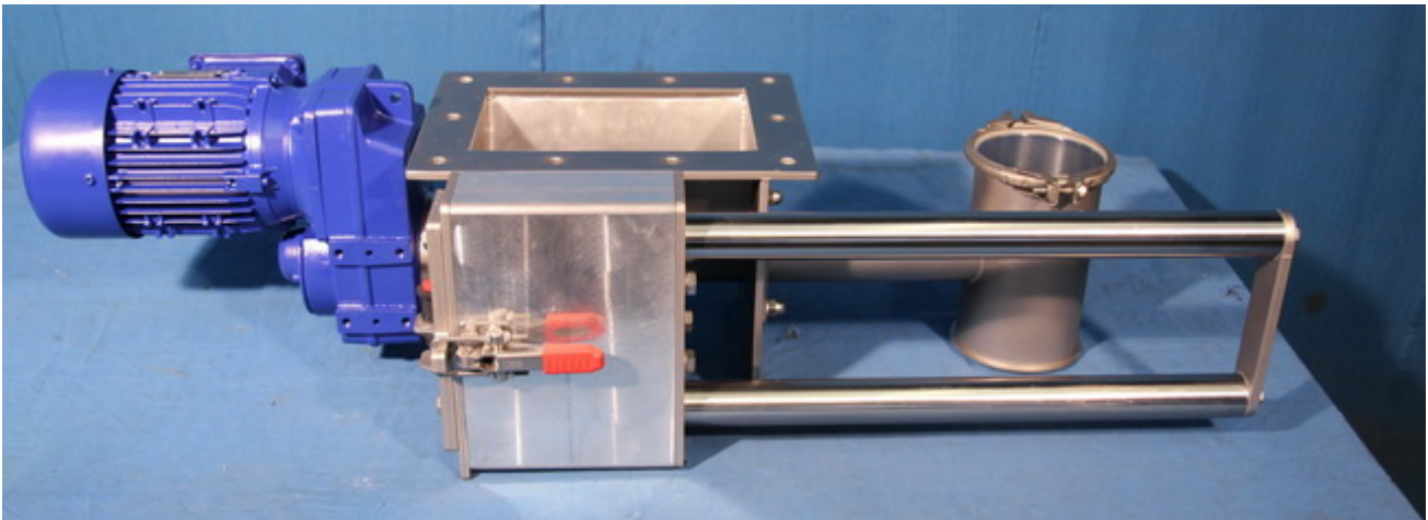
Dosierschnecke mit Gewindeauszugs- und Schwenkvorrichtung

Der gesamte Produktbereich der Dosierschnecke lässt sich so einfach und gründlich reinigen.